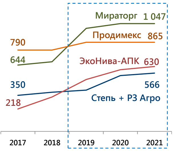
Лидеры по приросту земельного банка: динамика за пять лет, тыс. га